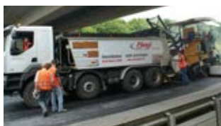
Der ASW wird nun auch als Spezialfahrzeug für Asphalt als Asphalt Profi-Thermo produziert.