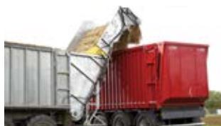
Drei verschiedene Überladebänder zum Anbauen kommen sowie ein neues Streuwerk mit Vario Sense.