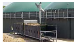
Dem Biogasboom kam Fliegl nicht nur mit dem Bau der Abschiebewagen entgegen. Mit dem System ist auch die Substratzuteilung für Biogasanlagen möglich.