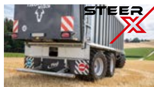
Elektronische Zwangslenkung SteerX