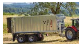
Der Silagegigant ASW Taurus wird als Linie eingeführt. Außerdem kommen sämtliche Neuerungen beim ASW Gigant: Neue Schiebewand Insight, ProtectPaket, Fliegl LED-Licht