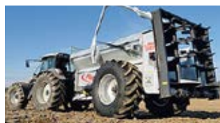
Reine Dungstreuer werden ab sofort auch mit Abschiebetechnik ausgestattet. Ebenso gibt es das Abschiebesystem nun auch für LKW.