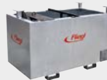
Auffangbehälter (gegen Aufpreis erhältlich)

Vereinbaren Sie Ihren Vorführtermin mit unserem technischen Berater: Tel. +49 (0) 8671 9600-409