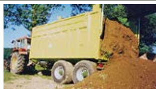
Der ASW Stone ist ein Abschiebewagen für hohe Belastungen und somit beliebt bei Lohnunternehmen im Baugewerbe.