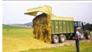
Der erste Abschiebewagen (ASW) von Fliegl verfügte über ein zulässiges Gesamtgewicht von 18 Tonnen.