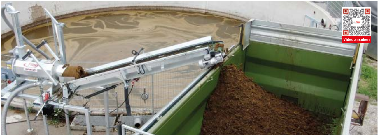
Mit 4,0 m Förderband (gegen Aufpreis erhältlich)