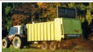
Zusätze wie Streuwerk, Entladeband oder Überladeschnecke gehörten schon bald zu den Ausstattungsvarianten der ASW.