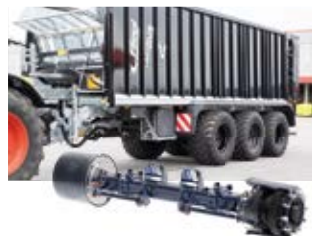
Triebachse mit 90kW DriveX