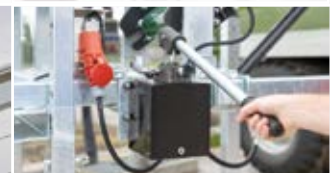
Handpumpe – dient zur Höhenverstellung des Förderbands